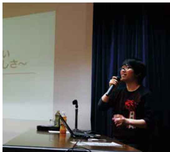
○第二講座《5月22日》こころと痛み

「視野を広げて豊かな人生を」をモットーに、五月八日の連休明けから七月三日まで、五講座を実施しました。オホーツク管内在住で、専門分野で多彩ご活躍されている講師を招聘し、ご講演をいただきましたが、多数ご来場いただきました市民の皆さまは、大変有益で好評を得ることができました。