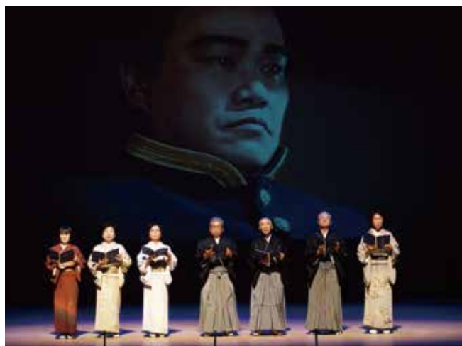
第42回総合芸術祭 (第73回きたみ市民芸術祭)